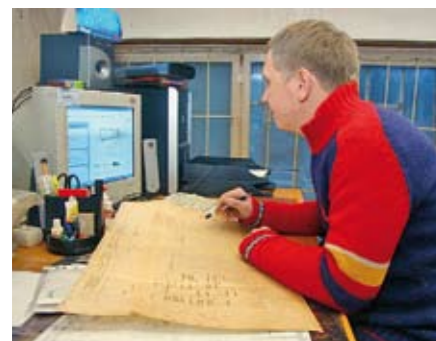
Обслуживание приборов и устройств безопасности