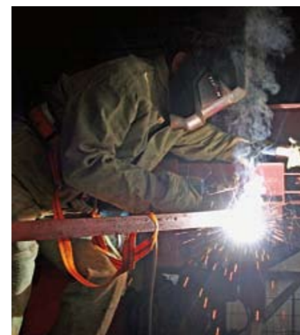
Ремонт металлоконструкций с применением сварки

Еще одним важным шагом в системе повышения эффективности развития стало внедрение на предприятии