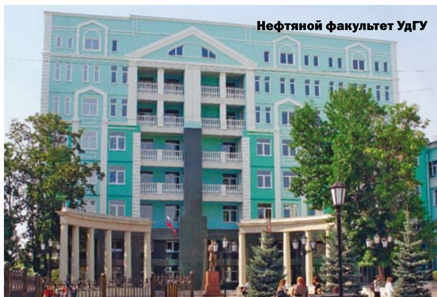
Нефтяной факультет УдГУ

Одно из них – завершение строительства завода по уничтожению химоружия в г. Щучье. В 2012 г. предстоит выполнить большой объем монтажных и пусконаладочных работ, а к концу года начать испы-