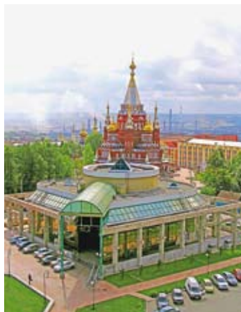
Музей Калашникова и Свято-Михайловский Собор

Одним из приоритетов Главного управления будет являться повышение качества строительно-монтажных работ. На предприятии действует система менеджмента