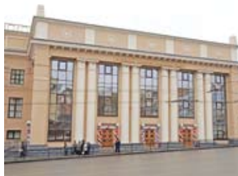
Русский драматический театр

качества, соответствующая требованиям стандартов ИСО серии 9000 (ГОСТ Р ИСО 9001-2001). «ГУССТ № 8» является членом НП «Межрегиональное объединение организаций специального строительства», а также членом НП «Межрегиональное объединение проектных организаций специального строительства».